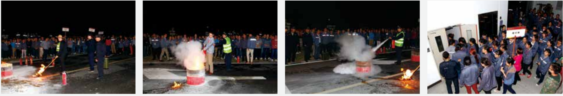
坚强的信心，能使平凡的人做出惊人的事业。

为了认真落实公司火灾事故的防范措施，增强员工的消防安全意识，消除火灾安全隐患，最大限度减少损失，确保公司财产安全，稳定工作及生活秩序。在公司保安队与公司领导的带领下组织策划了一次消防演习。11月12日下午18:30，在公司领导的大力支持下，在公司保安队的指导下组织了消防演习。 随着演习开始口令的下达，保安队点燃了事先准备好的易燃物，给员工们介绍了公司消防器材配备型号，讲解各类灭火器的使用方法，而后员工们亲身体会使用灭火器。在开始的时候，员工们面对燃烧的大火，明显感到紧张和不知所措，随着演习的深入，员工们逐渐适应，大胆拿起灭火器进行灭火。演习结束后，保安队长对演习进行总结，管理者代表和行政人事部对此次演习作了点评，对员工们积极参加消防疏散演练的表现给予了充分的肯定，也指出了存在的不足，并希望员工们在今后能主动、积极参与公司的消防安全工作，为保安队献计献策，共同做好公司的消防安全工作。